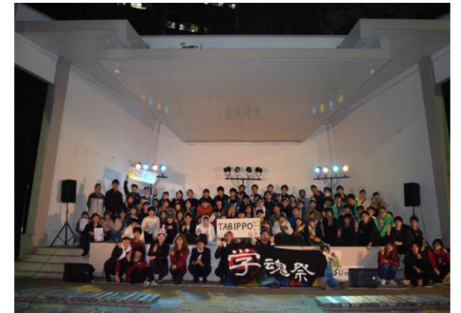
第5回学魂祭集合写真