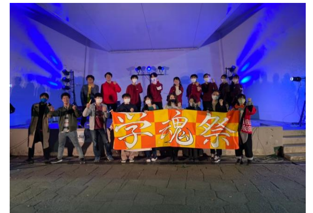
第6回学魂祭集合写真